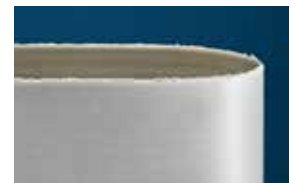
主要竞争对手的同类皮带